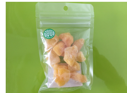
パイナップル リパック例